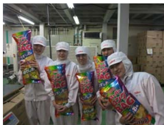
時短勤務者で構成する 「てづくりチーム」 新宇都宮工場で活躍中